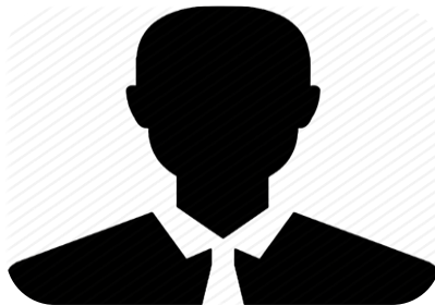
רו"ח עבד אלחכים ג'בארה חבר דירקטוריון