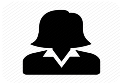
עו"ד רולא חמארשה חברת דירקטוריון